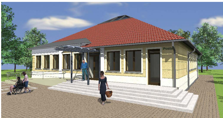
(A Polgármesteri Hivatal látványterve)

Megítélt támogatás: „A” típusú tornaterem építésének finanszírozása