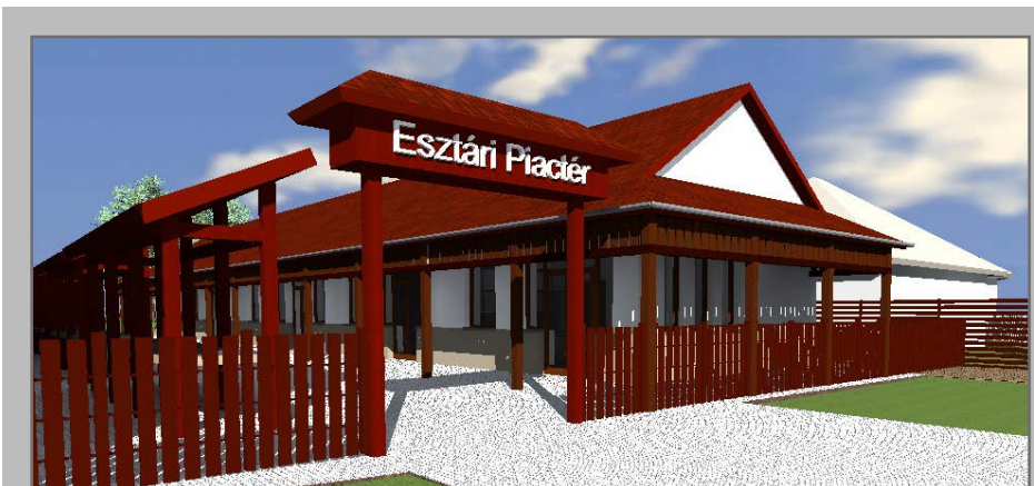
(Az Esztári Piac tér látványterve)

A településfejlesztés szempontjából 2 fejlesztést tartottunk, és tartunk most is nagyon fontosnak, egyik egy komplex egészségház kialakítása ahová a település egészségügyi szolgáltatásait kívántuk integrálni, a másik projekt a munkahelyteremtés szempontjából élvezett prioritást, amikor is ipari park (ipari terület) kialakítására nyújtottunk be pályázatot. Sajnos mindkét projekt-igényünk elutasításra került, de továbbra is fontos fejlesztési területekről beszélünk, ezért a jövőben próbálunk újabb forrásokat keresni az elképzelések megvalósításához. A még támogatói döntéssel nem bíró pályázatok közül nagy várakozással tekintünk többek között a bölcsőde kialakítása, új települési piac létrehozása vagy akár sportöltöző kialakítása elé.